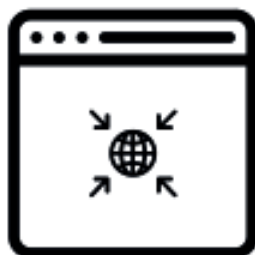
新規Boosterサイト WEB MAGAZINE Portal site